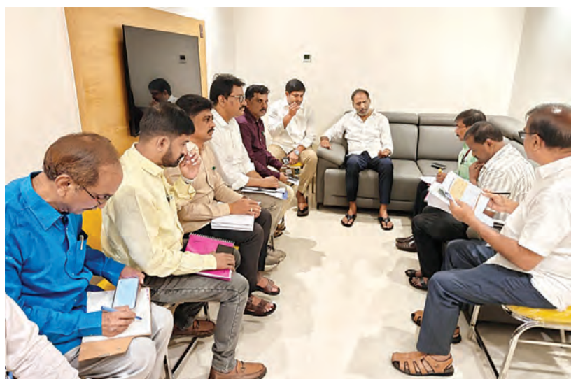
విద్యుత్ శాఖ ఉన్నతాధికారులతో సమీక్ష సమావేశం నిర్వహించిన మంత్రి గొట్టిపాటి