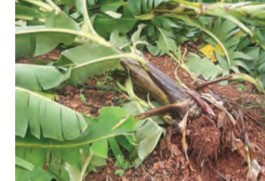
గుణకణపల్లిలో దెబ్బతిన్న అరటిపంట, గాలులకు నేలకొరిగిన అరటిపంట

పులివెందుల మే 23 ప్రభావవార్త : నియోజకవర్గంలోని లింగాల మండలంలో గురు వారం ఆర్దరాత్రి వీచిన రాకాసి గాలులు రైతులను అశలను భిద్రము చేశాయి. మండల పరిధిలోని ము రారాచింతల, తాళిరెడ్డిపల్లి, గుణకణపల్లి తదితర గ్రామాలలో పంటలు గ్రామాల్లో వందల ఎకరాల్లో సాగుచేసిన అరటి తోటలు నేలకొరిగాయి. మొన్నటి వరకు పశ్చిమ ఆసియా దేశాల మధ్య జరిగిన యుద్ధ ప్రభావంతో ఎగుమతులు ఆగిపోవడంతో అరటి ధర లు మాడు వేలు రూపాయల కంటే తక్కువకు పడి పోవడంతో అరటి సాగు రైతులు పెట్టుబడి రాక అ ప్పుల ఊటిలోకి పడిపోయారు. ఆ బాధ నుంచి కో లుకోక ముందే పుండు మీద కారం చలిస్తట్లు ఒక్క సారిగా వీచిన భారీ ఈడుగుగాలులకు పంట పూర్తిగా దెబ్బతినడంతో రైతు కుటుంబాలు తీవ్ర ఆందోళనకు గురయ్యాయి. అప్పులు చేసి సాగు చేసిన పంట కళ్ళముందే నేలమట్టం కావడంతో బాధిత రైతులు కన్నీరుమున్నీరుపెతున్నారు. విషయం తెలుసుకున్న